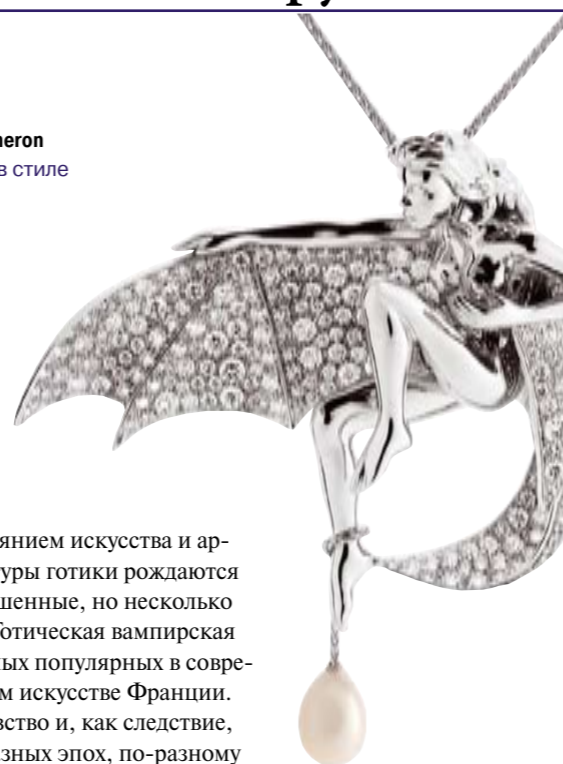
Колье Boucheron коллекция в стиле нео-готика

Под влиянием искусства и архитектуры готики рождаются возвышенные, но несколько мрачные образы. Готическая вампирская тема – одна из самых популярных в современном ювелирном искусстве Франции.