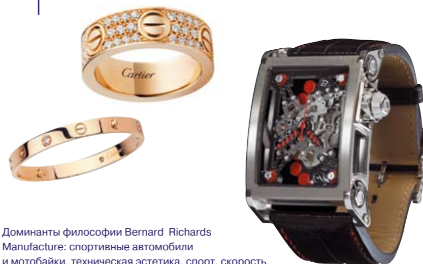
Доминанты философии Bernard Richards Manufacture: спортивные автомобили и мотобайки, техническая эстетика, спорт, скорость.

Новая техногенная эра XX столетия культивировала такие стили, как функционализм и хай тек. Не сразу, частично под влиянием постмодернистской ироничности, активно выраженные конструкции, элементы креплений, механизмы, присущие этим стилям, пришли в ювелирное и часовое дело. Сейчас — это один из основных трендов часового дизайна.