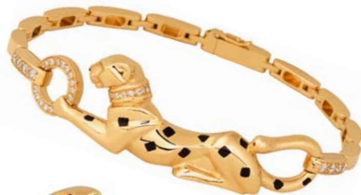
Браслет и кольцо Cartier Страсть к деталям, изысканность, эргономичные формы

Отличительные черты — геометрические узоры, роскошь, шик, дорогие, современные материалы (слоновая кость, крокодиловая кожа, алюминий, редкие породы дерева). Эстетика ар деко актуальна и в наши дни. Роскошь и дорогие материалы не утратили притягательности. Очень многие дома представляют последние коллекции, в которых чувствуется влияние ар деко.