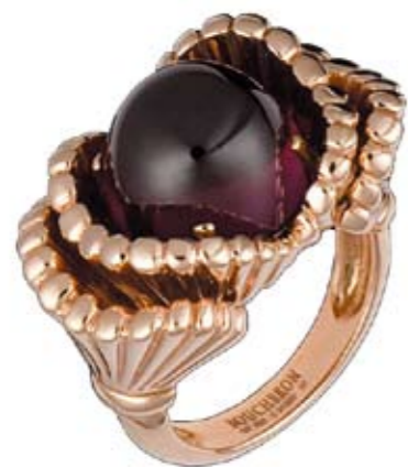
Кольцо Boucheron Биоморфная прерая пластика ар нуво придает загадочную притягательность этим шедеврам ювелирного искусства

Во второй половине XIX века Франция занимает лидирующие позиции в искусстве, а затем — и в дизайне. Импрессионисты объявили войну академизму, новые концепции и стили возникают и захватывают общество, как снежная лавина: появляются постимпрессионизм, модернизм. Можно сказать, что наблюдения Моне за солнечным светом привели в конечном итоге к созданию синтетических стилей. Художественная жизнь Парижа бурлила в те времена. Не случайно именно во Франции появился ар нуво — первый единый синтетический стиль, в котором все элементы из окружения человека были выполнены в одном ключе.