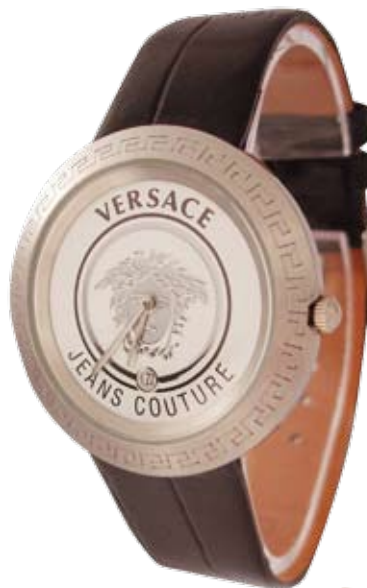
Versace: меандры, медальон с головой Медузы Горгоны