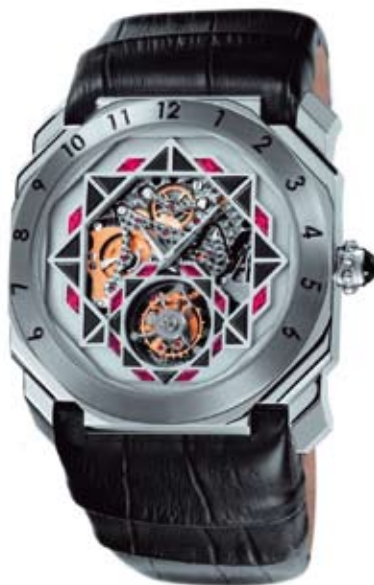
Gerald Genta: экспрессивные формы, сложность композиции, четкие грани, яркий цвет, графичные орнаменты, декоративные поверхности