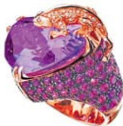
Adolfo Courrier: неожиданные детали – ящерка