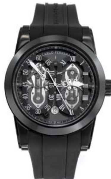
Carlo ferrara: большой размер, экспрессивные формы