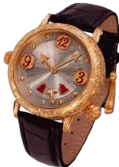
Zannetti: экспрессивные формы, крупные размеры, выраженные детали, четкие грани, орнаменты

* Меандр – распространенный античный геометрический орнамент, состоящий из непрерывной кривой (волнообразной) или ломаной под прямым углом линии, образующей ряд спиралей.