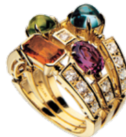
Bulgari: Экспрессивные образы, неожиданные решения, графичность, цветовые контрасты