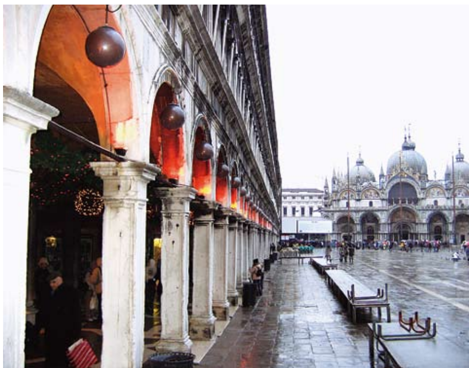
Венеция. Площадь Св. Марка

Понятие «итальянский дизайн» в полной мере относится к ювелирному и часовому дизайну. Когда объект создается с такой прекрасной целью, как находиться на изящном запястье, итальянский дизайн проявляет себя без всяких ограничений. Последние коллекции навеяны разными стилями и направлениями, но их объединяет креативность и тот самый итальянский стиль.