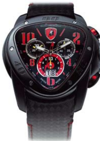
Tonino Lamborghini: динамичная нестандартная форма (треугольные часы), техническая эстетик: активно выраженная конструкция, элементы автомобильного дизайна